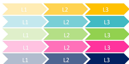
Exemple 1 : Toutes les compétences sont travaillées en parallèle durant tout le cycle de formation

Plusieurs configurations pourront être étudiées en tenant compte de la spécialisation progressive des étudiants. Voici deux exemples, non exhaustifs, donnés à titre indicatif :