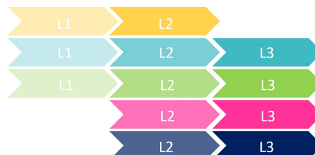
Exemple 2 : Les compétences sont travaillées sur une partie du cycle.